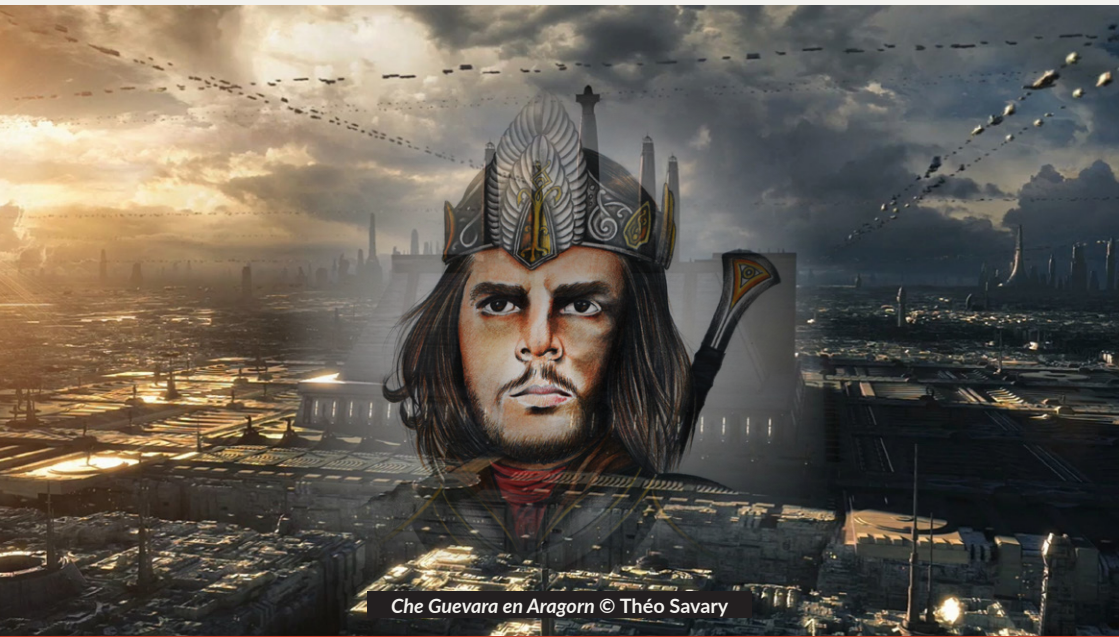
Che Guevara en Aragorn © Théo Savary

MOBILISER L'IMAGINAIRE COLLECTIF CONTRE L'URBANISATION CAPITALISTE